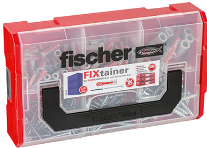
DUOPOWER in Box